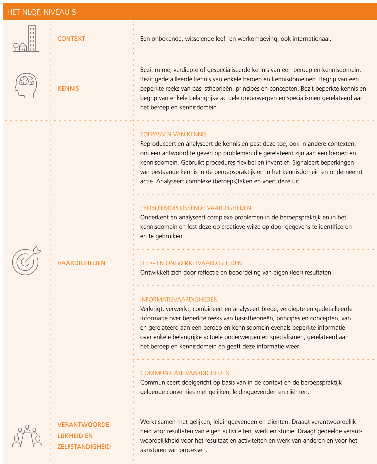
Figuur 4 Het NLQF, niveau 5

Een student wordt opgeleid om in een organisatie te gaan werken, waarin hij professioneel werkt, volgens de standaarden die gelden in die context. Naast het beschikken over relevante en actuele kennis die een student kan toepassen bij het werken, is communicatie het middel om deze kennis te kunnen toepassen in een organisatie. Een student heeft met collega's en klanten te maken, binnen en buiten de organisatie. De student heeft zich, met andere woorden, tot zijn omgeving te verhouden en communicatie is hiertoe het middel. Wat betreft het 'lerend vermogen' zijn in de Dublin Descriptoren voor de Short Cycle de leervaardigheden in een apart leerresultaat beschreven, terwijl ze bij het NLQF onder de vaardigheden zijn geschaard.